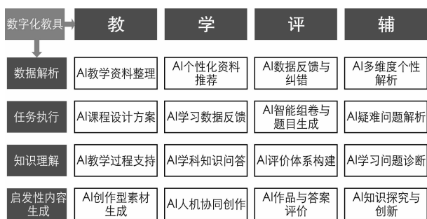
图2 数智化教具运用

度。学习活动不再局限于传统教材,而是通过互动模拟和游戏化学习等手段,使知识的获取过程变得生动有趣。智能教具能够实时监控学生的学习进度和掌握情况,并运用大数据分析技术精确识别学习难点和兴趣点,为每位学生定制个性化学习方案,实现差异化教学策略,确保每位学生均能在最适宜的节奏中发展。在评估环节,智能评估系统通过自动化测评和即时反馈机制,不仅减轻了教师的工作量,还能够迅速提供详尽的学习成效报告,帮助学生及时发现并弥补知识漏洞,同时为教师提供了丰富的教学反馈信息,便于教师调整教学策略。在辅导方面,智慧教具提供的在线答疑和智能辅导服务,实现了24小时不间断的教育支持,无论是在解答学术疑惑还是在激发创新思维方面,均能提供及时有效的帮助,真正实现了教育的全时、全方位覆盖。