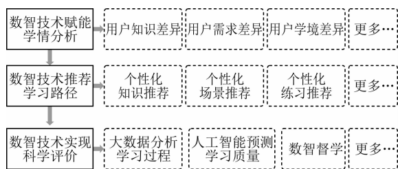
图2 数智赋能应用过程

数字教材的建设过程不是一蹴而就的过程。随着知识内容的变化、技术手段的更新以及学习者学情状况的不同等,都需要数字教材与时俱进,动态更新,因此数字教材是迭代改进的,可以在实际应用过程中通过人工智能技术和大数据分析技术等手段,对数字教材的改进指明方向。人工智能和大数据技术融入数字教材建设,应该全方位体现在数字教材应用的全过程,主要包括下图2所示内容: